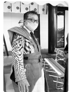
今年：マスク着用で