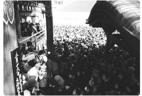
以前のにぎやかな節分の豆まき