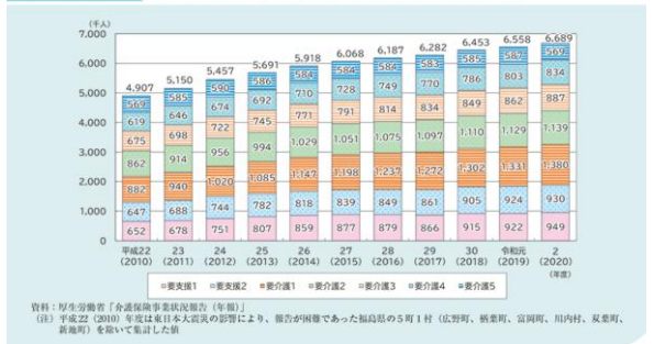
図1-2-2-5 第1号被保険者（65歳以上）の要介護度別認定者数の推移

社会福祉制度は、高度経済成長期を迎え、 保護と救済 とは別に、生活を支えるための 幅広い領域のサービス が求められるようになり、行政主体の措置制度から、利用者主体の制度への変革が始まった。